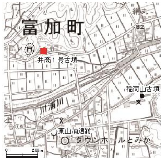
図1 井高1号古墳位置図

墳丘 ふんきゅう は、標高75.4m付近でわずかに傾斜が緩やかになる。このラインは石室開口部の前面にある平坦部とも高さが揃ってくる。これがテラスの平坦面と考えられるため、二段築成 ちくせい と考えた。墳頂部は南北に僅かに長いほぼ正方形の平坦面を形成し、標高は79.2mである。墳丘最下段の標高は約74mと想定できるので、墳丘の高さは約5.2mとなる。墳丘上段の規模は東西17.3m、南北16.4mで高さは約4.7mとなり、墳丘下段の高さは約1.5mと推定できる。