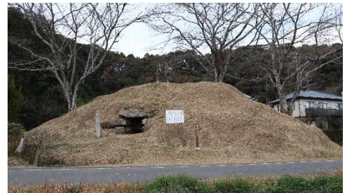
墳丘と石室開口部（南から）